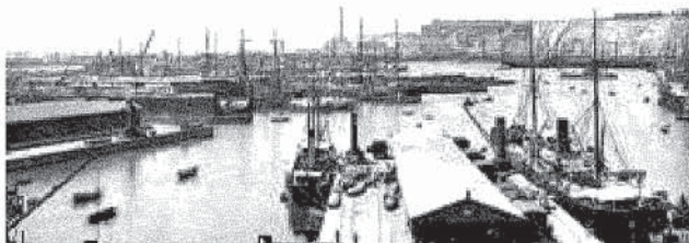
Il porto di Genova, crocevia di genti, nella mostra “Genova porto di emigranti”

LA STORIA IN PIAZZA è a cura di Donald Sassoon con il coordinamento di Luca Borzani e Antonio Gibelli Sotto l'alto patronato del Presidente della Repubblica Realizzazione: Genova Palazzo Ducale Fondazione per la Cultura, Centro Culturale Primo Levi, Comune di Genova, Fondazione Ansaldo, Fondazione Edoardo Garrone, Università di Genova, Ilsec Con il contributo della Camera di Commercio di Genova Con il patrocinio di Les Rendez-Vous de l'Histoire di Blois Sponsor: Coop Liguria e Latte Tigullio Sponsor istituzionale: Iren Gruppo