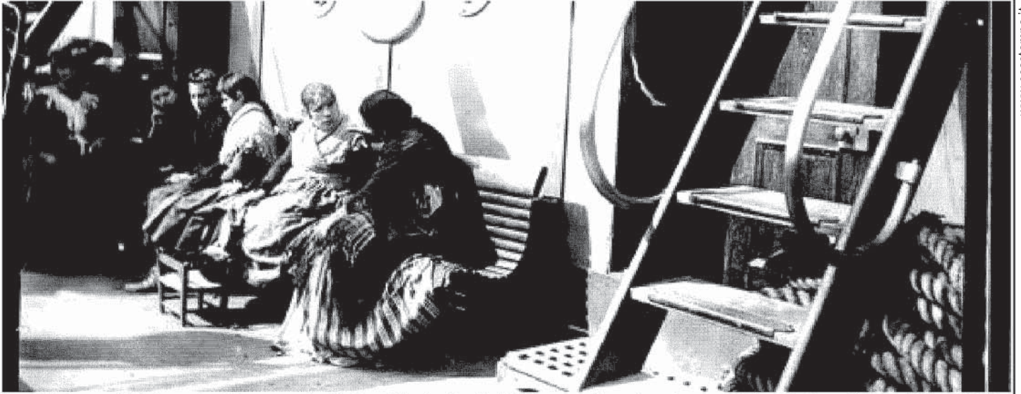
Una delle immagini della mostra "Genova porto di migranti", allestita alla Sala Dogana: donne in partenza per l'America in una foto scattata nel 1900